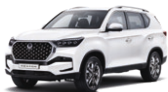
Silky White Pearl (WAK)*