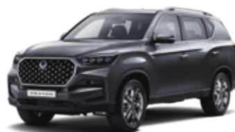
Marble Grey (ACM)*