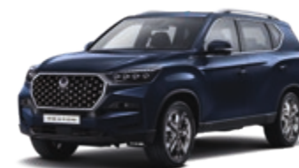
Atlantic Blue (BAU)*