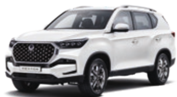
Grand White (WAA)